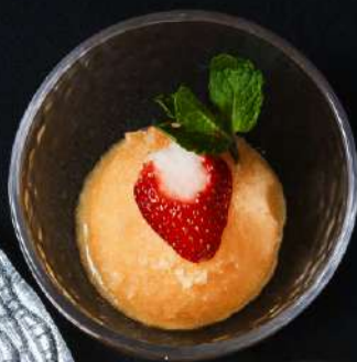
季節のシャーベット