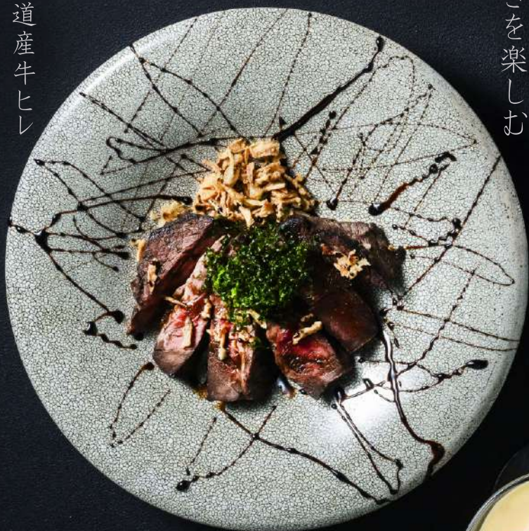
道産牛ヒレ バルサミコソース