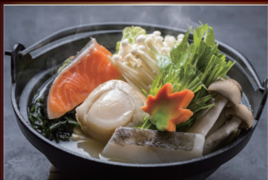
浜鍋 1人前 ¥2180